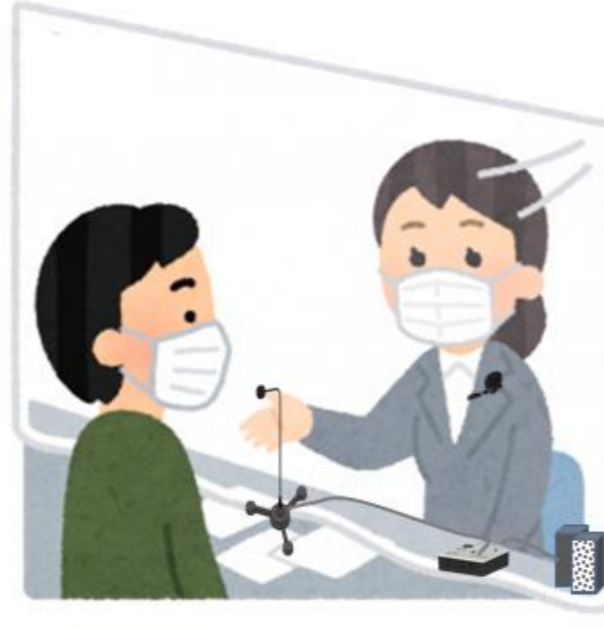
無線方式/ピンマイク・スタンドマイク