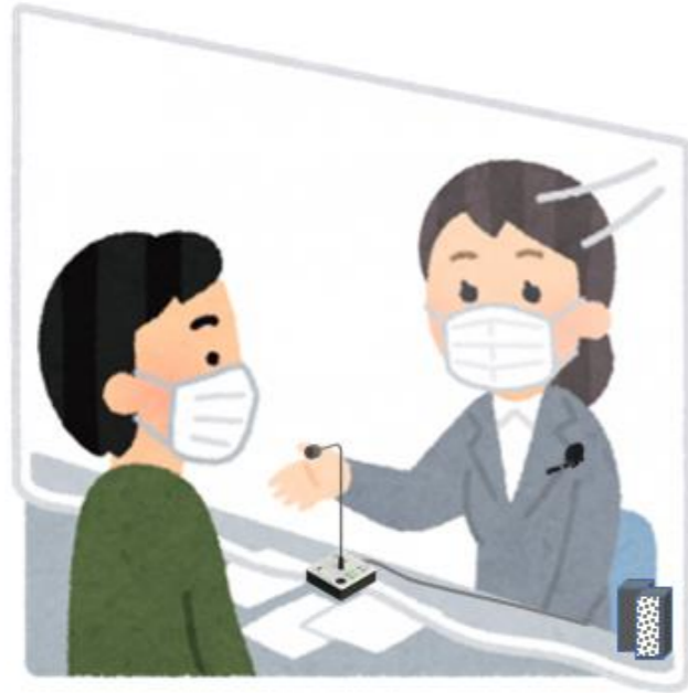
無線方式/ピンマイク・本機マイク